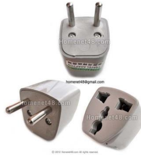
หัวแปลงจากแบนเป็นหัวกลม